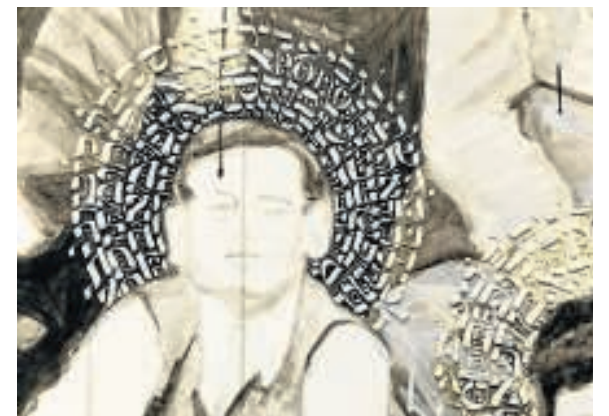
Vader van de kunstenaar. beeld André Dorst