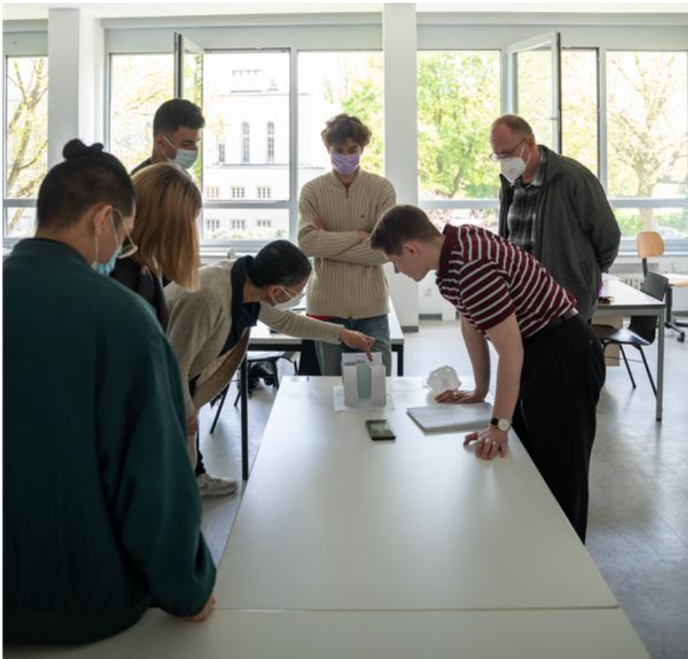
Bielefeld University of Applied Sciences, FH Bielefeld, Faculty of Design, Germany, 2022

הסדנה עוסקת במערכות היחסים שבין גוף האדם, חלל הפנים והאובייקטים המתקיימים בו. מטרתה להקנות כלים ומיומנויות לעבודה של הצבה במרחב, מתוך מודעות לתנועת הגוף ולהשפעתה על חוויית החלל.