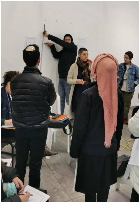
פרדס, בית ספר לאמנות, 2021 - 2022