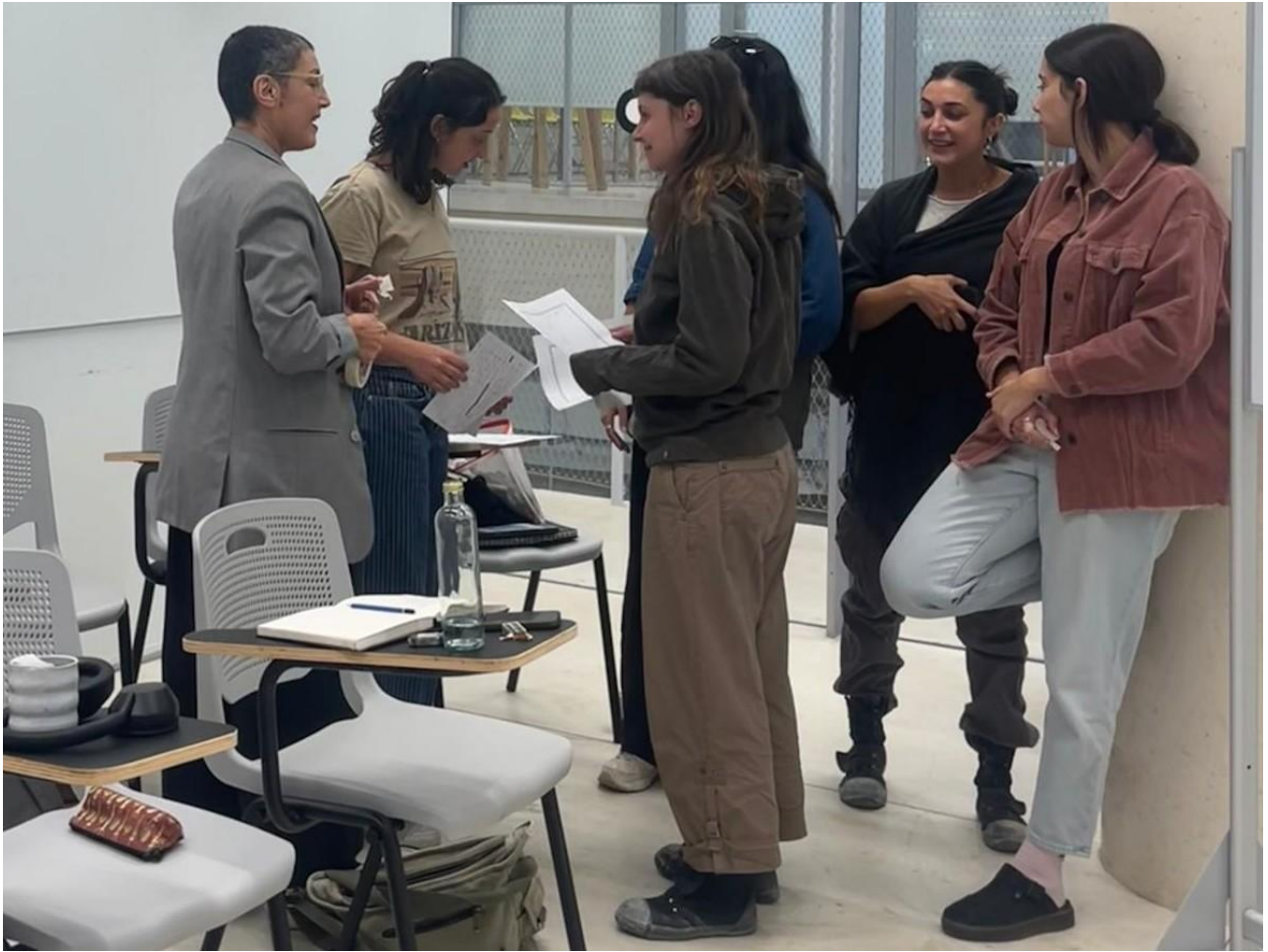
המחלקה לעיצוב קרמי וזכוכית, בצלאל, ירושלים, 2025