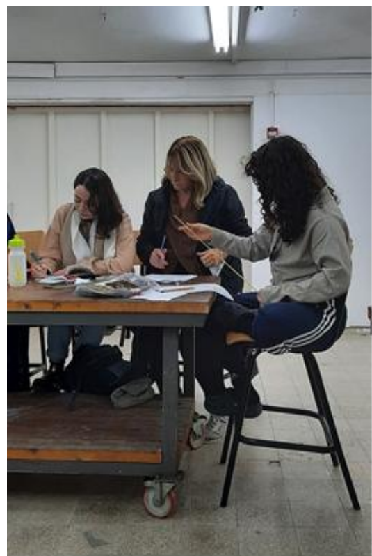
מחלקה לאמנות, מכללה אקדמית ספיר, 2022