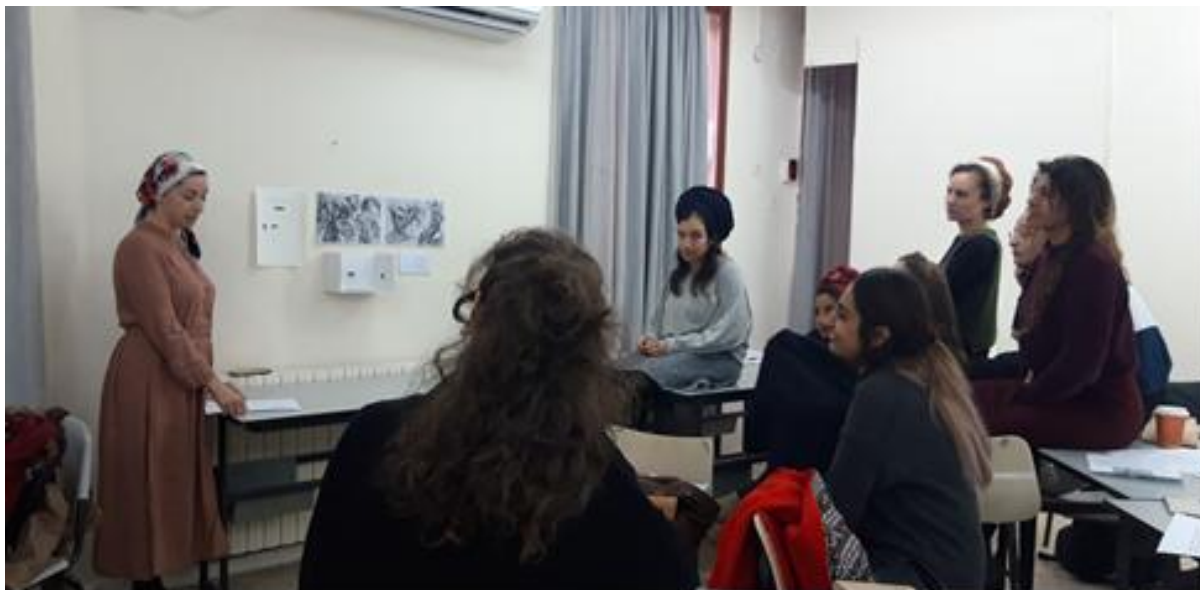
מחלקה לאמנות, מכללת אמונה, ירושלים, 2019